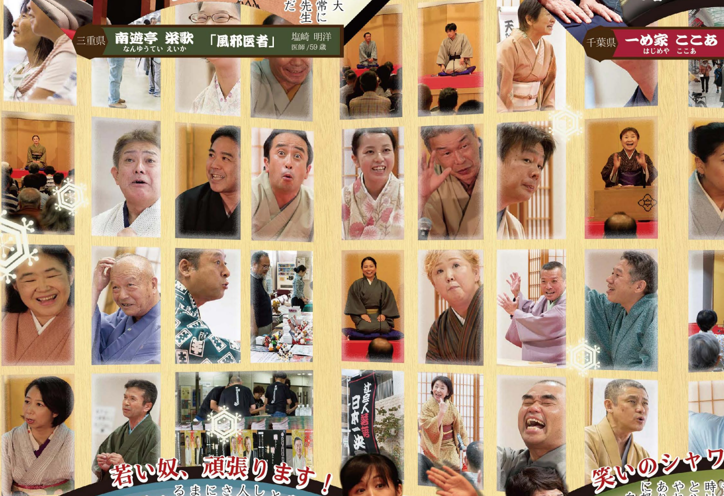
千葉県 一め家 ここあ はじめや ここあ